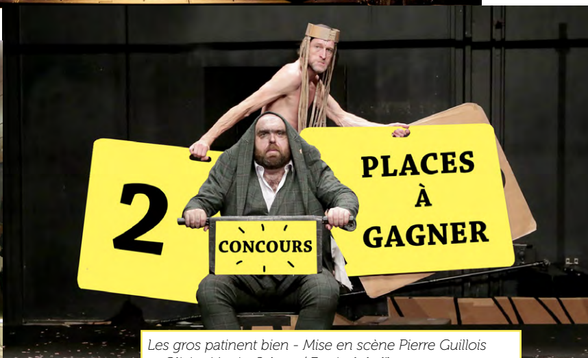
Les gros patinent bien - Mise en scène Pierre Guillois et Olivier Martin-Salvan / Festival de l'humour