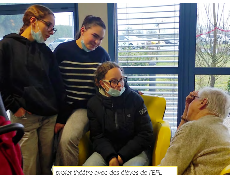
projet théâtre avec des élèves de l'EPL Agro et des résidents d'EHPAD

L'acb, scène nationale a pu consolider sa soutenabilité en renforçant ses recettes propres (recettes de billetterie et appels à projets) et avec l'aide renforcée de la ville et de l'état dans le cadre du plan Mieux Produire Mieux Diffuser .