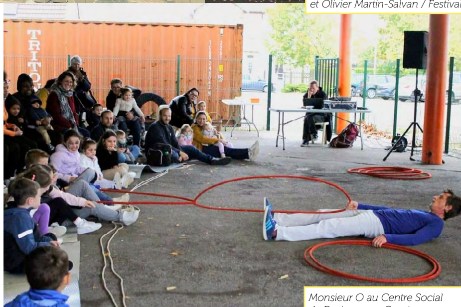
Monsieur O au Centre Social de Revigny-sur-Ornain